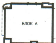
РАЗПРЕДЕЛЕНИЕ ВТОРИ ЖИЛИЩЕН ЕТАЖ ЗП 233.25кв.м