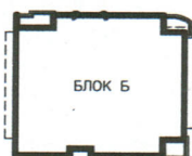
РАЗПРЕДЕЛЕНИЕ ЧЕТВЪРТИ ЖИЛИЩЕН ЕТАЖ ЗП 227.73кв.м