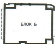
РАЗПРЕДЕЛЕНИЕ ВТОРИ ЖИЛИЩЕН ЕТАЖ ЗП 227.73кв.м